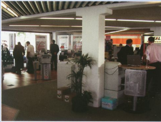
Mehr als Verkauf: Der Vollsortimenter beschäftigt auch zwei Meister und 25 Gesellen für den technischen Service.