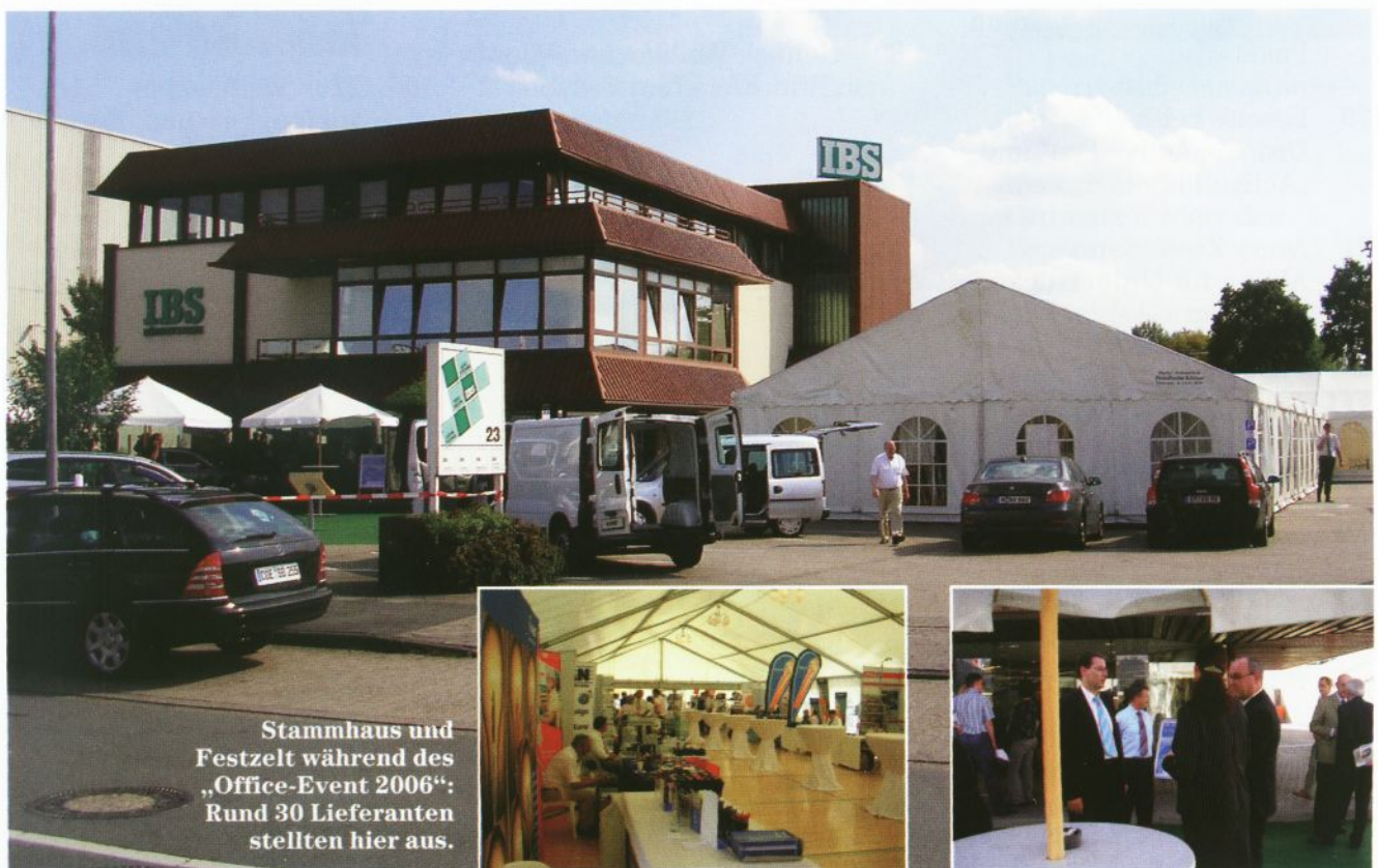
Stammhaus und Festzelt während des „Office-Event 2006“: Rund 30 Lieferanten stellten hier aus.

Teil sich die Bürobedarfs-Lieferanten des Unternehmens in einer Ausstellung präsentierten. Dahinter gab es für Geschäftspartner und Freunde des Hauses allerlei „Ohren- und Gaumenfreuden“ zu genießen. Im Erdgeschoss des Stammhaus selbst zeigten Bürotechnik-Hersteller ihre